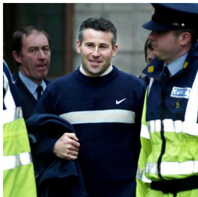
Zdjęcie 2. Liam Campbell

Michael McKevitt, urodzony 4 września 1949 roku, swoją działalność w strukturach irlandzkich organizacji terrorystycznych rozpoczął od członkostwa w Tymczasowej IRA (PIRA). Od początku lat 80. XX wieku pełnił funkcję generalnego kwatermistrza i nadzorował składowanie broni oraz poruszanie się grupy. Struktury PIRA opuścił w 1997 roku na rzecz RIRA, w ramach sprzeciwu wobec zawartego Porozumienia Wielkopiątkowego. McKevitt stał się przywódcą organizacji, która odrzuciła postanowienia porozumienia z 1997 roku i nadal przeprowadzała ataki terrorystyczne w Irlandii i Wielkiej Brytanii. W 2003 roku skazano go na dwadzieścia lat więzienia za udział w zamachu w Omagh, do którego się nie przyznał. Twierdził, że władze brytyjskie i irlandzkie miały świadomość braku jego udziału w tym zamachu. Według informacji ujawnionych w procesie, jego plany obejmowały m.in. próbę zamachu na ówczesnego premiera Wielkiej Brytanii Tony'ego Blaira. Przedwcześnie zwolniony z więzienia w 2016 roku, zmarł w styczniu 2021.