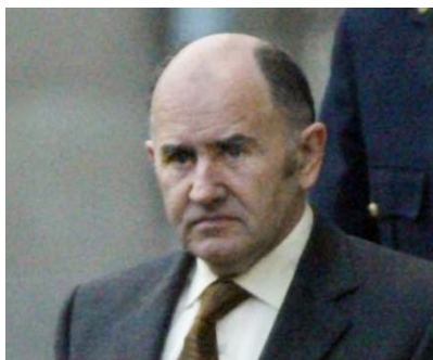
Zdjęcie 1. Michael McKevitt