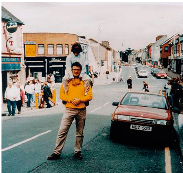
Zdjęcie 3. Zdjęcie zrobione przez hiszpańskiego turystę na kilka chwil przed wybuchem bomby w Omagh. Czerwone auto na zdjęciu to samochód-pułapka, który eksplodował.