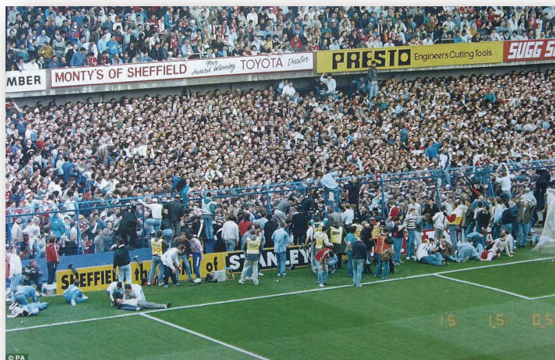
Zdjęcie 5. Wypelnienie centralnych sektorów trybuny Leppings Lane