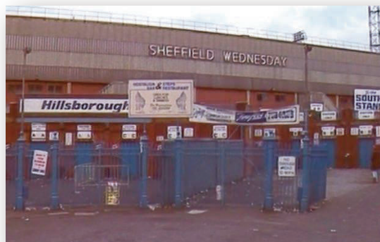
Zdjęcie 1. Obszar wejściowy na stadionie Hillsborough od strony trybuny Leppings Lane