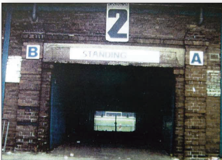
Zdjęcie 4. Wejście na trybunę Leppings Lane – ciąg komunikacyjny, którym tłum „dociskał”, miażdżył i dusił kibiców obecnych na środkowych sektorach trybuny